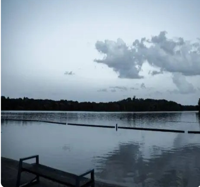
Bild WolfsseeBild WolfsseeBild Wolfssee